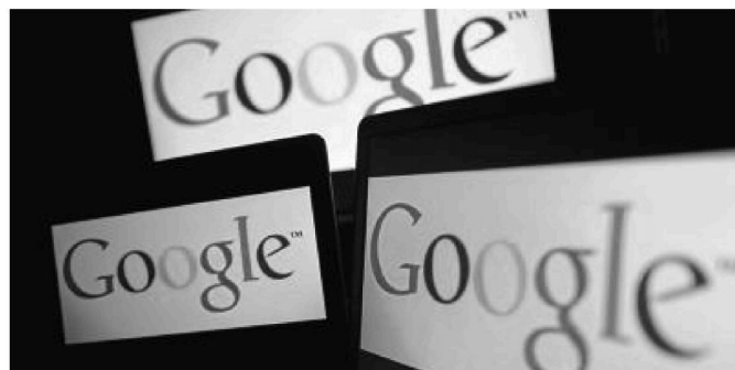
Le moteur de recherche est accusé par l'exécutif européen d'abus de position dominante.

La Commission se donne encore quelques mois avant de trancher au premier semestre 2014. Elle peut continuer sur la voie de l'accord à l'amiable avec Google, en acceptant ces propositions en l'état ou en demandant une nouvelle amélioration. Autre possibilité – réclamée par les opposants –, une « communication des griefs » peut être envoyée au groupe américain, ouvrant la voie à un conflit dur et très long, similaire à celui engagé avec Microsoft pendant la dernière décennie et qui a débouché sur des centaines de millions d'euros d'amendes.