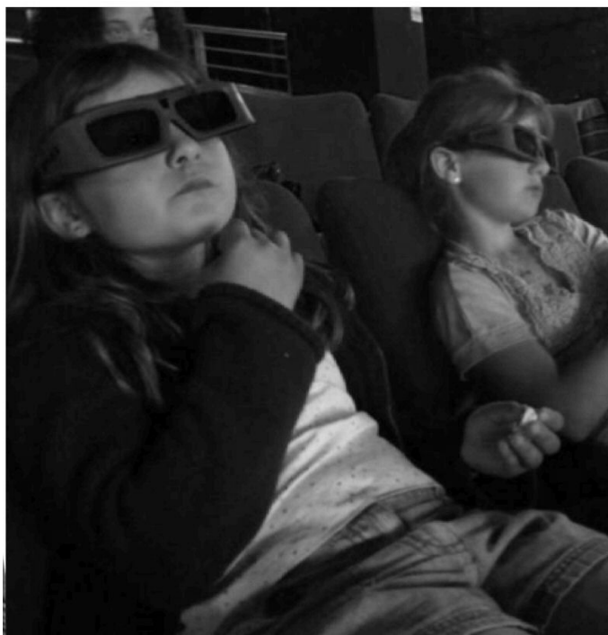
Les plus jeunes, qui déboursent en moyenne 5,50 € pour voir un film sur grand écran, ne paieront plus que 4 €, et ce quels que soient le jour et l'horaire.